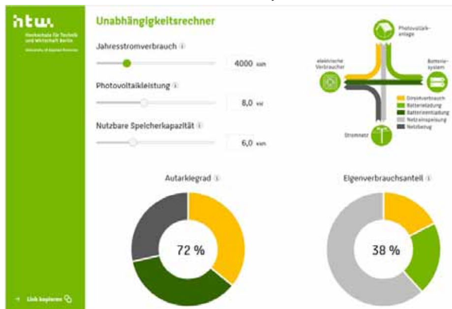
Bild 1: Ausschnitt Unabhängigkeitsrechner HTW Berlin (solar.htw-berlin.de/rechner)

Es stellt sich auch die Frage, wie groß der Speicher sein sollte, d.h. welche Speicherkapazität der Batteriespeicher haben sollte und welchen Autarkiegrad man dann damit entsprechend erreichen kann? Das hängt einmal vom jährlichen Verbrauch und der installierten Solarleistung in kWp ab sowie auch vom täglichen Strombedarf und dessen Verteilung über die 24-Stunden (Tag- und Nachtanteil). Als erster Anhaltspunkt gilt, dass die nutzbare Kapazität der Batterie etwa einen 24-Stundenbedarf in kWh abdecken sollte. Wer vor hat, noch zusätzlich ein BEV (Elektroauto) zu laden und eventuell noch einen mit Solarstrom betriebenen Heizstab zur Warmwasseraufbereitung installieren möchte, sollte den Speicher dann größer dimensionieren. Allerdings sollte der Speicher nicht größer sein als etwa die 1,2–1,5-fache Peakleistung des Solargenerators, da ansonsten sich die Speichereffizienz verschlechtert und unnötige Anschaffungskosten entstehen. Eine erste gute Abschätzung kann z.B. jeder sehr einfach mit dem Unabhängigkeitsrechner der HTW Berlin (Hochschule für Technik und Wirtschaft) machen. Siehe Bild 1.